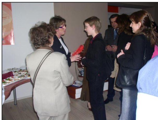
Slavnostní otevření DebRA Centre Zagreb