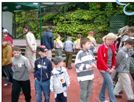
Herní program pro děti na konferenci DebRA ČR

V pátek 26.5. 2006 probíhal v klinickém EB centru FN Brno II. klinický den. V rámci klinického dne mělo 20 předem objednaných lidí žijících s EB možnost navštívit ambulance tří lékařů, specialistů jednotlivých oborů, konzultovat s nimi svůj zdravotní stav a absolvovat některá vyšetření. Pracovnice o.s. DebRA ČR zajišťovaly v průběhu celého dne dětem s EB a jejich rodičům „zázemí“ v podobě občerstvení, možnosti posezení, popovídání a oddechu v příjemném prostředí výtvarné dílny v areálu FN Brno. V pozdních odpoledních hodinách se účastníci klinického dne přesunuli do brněnského hotelu Myslivna, kde bylo připraveno občerstvení a ubytování pro mimobrněnské účastníky.