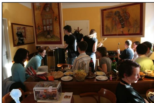
Vernisáž výstavy „Doteky motýlích křídel“ v Café 99