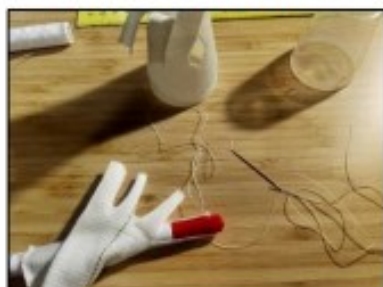
4. Navlékneme na fixu nebo jiný válcovitý předmět a připravíme si jehlu a niť. Niť připevníme > 2 mm od rohu látky.