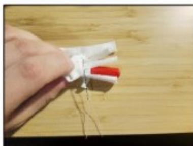
8. Rukavičku otočíme a střídavým stehem šijeme 1. stranu 2. prstu.