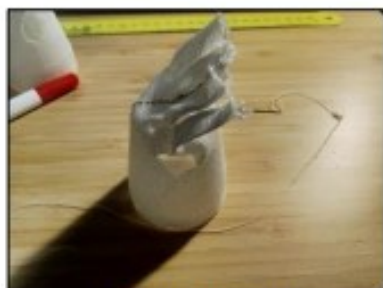
10. Hotová rukavička.