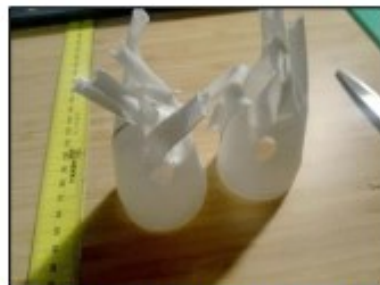
3. Připravíme si 2 Coverflexy na dvě rukavice.