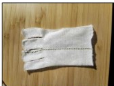
11. Můžeme ještě přezehlít přes plátno na nejnižší stupeň žehličky.