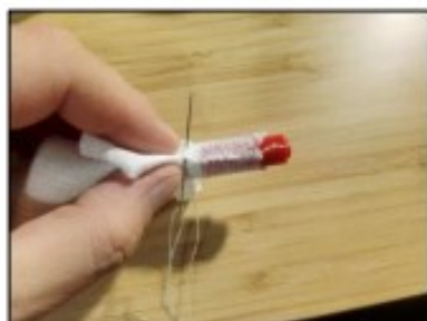
7. Došijeme prst až do konce. 1. a 4. prst potřebují zašít pouze na 1 straně.