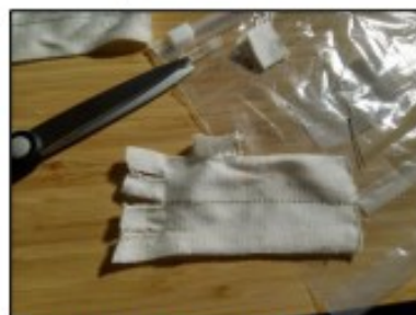
12. Přisitím kousku materiálu na otvor pro palec můžeme vytvořit rukavičku pětiprstou. (Jak našít palec viz následující kapitola.)

Celý dokument naleznete: https://www.ebcentrum.cz/zkusenosti-pacientu/t1473