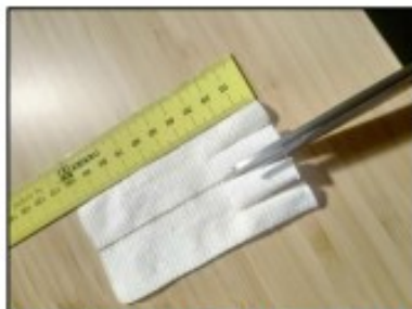
2. Rozstříháme podélně na půlku a opět na čtvrtinky. Vystříháme na straně otvor na palec.