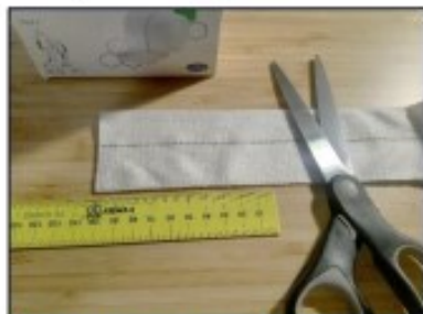
1. Ustříháme Coverflex cca 10 cm (pro jednoduchou rukavičku) nebo 15 cm (pokud chceme přetahovat zpět přes palec)