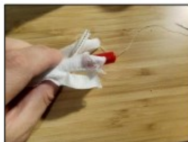
9. Došijeme ke konci prstu a opět otočíme. Na konci prstu můžeme obšít horní okraj a pokračovat zase dolů.